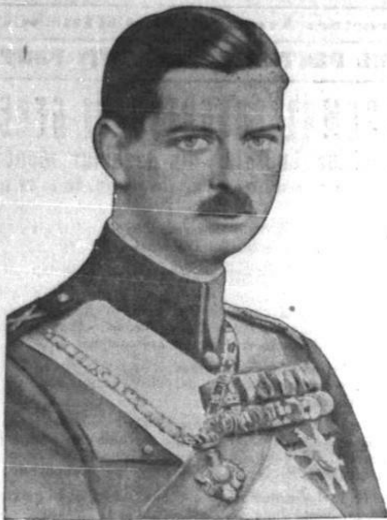
M. S. Carol al II-lea