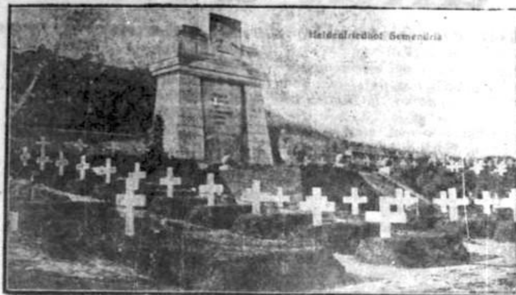
Cimitirul eroilor din Semendria