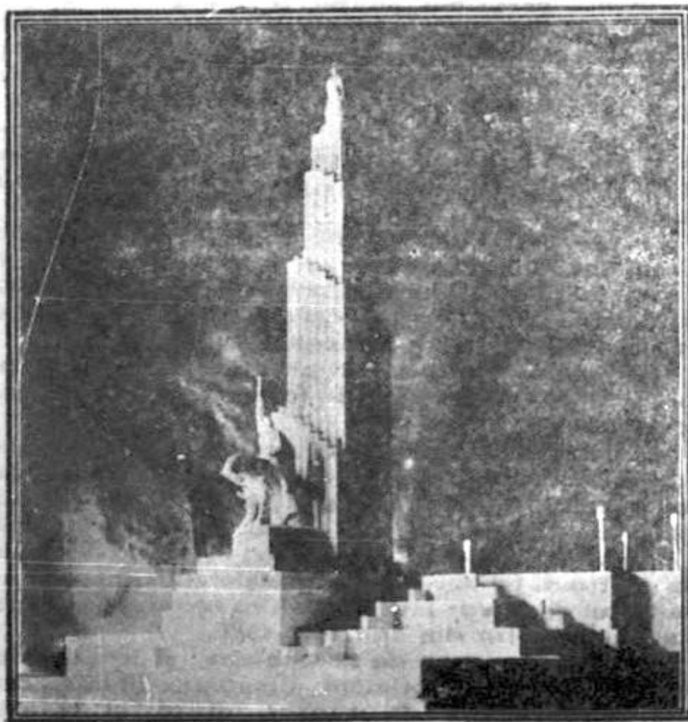
Unul din monumentele Dobrogei

Nici unul din demobilizații noștri sau din membrii societății Veteranilor Dobrogei Făuritori ai României Mari să nu lipsească dela congresul de Duminică.